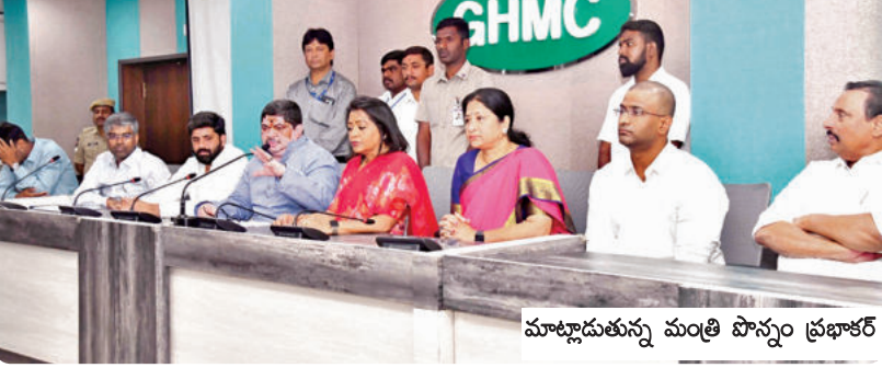
మాట్లాడుతున్న మంత్రి పాస్పాం ప్రభాకర్

హైదరాబాద్, జనవరి 12, ప్రభాకర్ వార్త: అర్బులైన ప్రతి ఒక్కరికీ రేషన్ కార్డు, ఇందిరమ్మ ఇల్లు మంజూరు చేస్తామని రాష్ట్ర బి సి సంక్షేమం, రవాణా శాఖ మంత్రి, హైదరాబాద్ జిల్లా ఇంజనీరింగ్ మంత్రి పాస్పాం ప్రభాకర్ అన్నారు. ఆదివారం జిహెచ్ఎంసీ హాల్ ఆఫీస్ లో హైదరాబాద్ జిల్లా ప్రజాప్రతినిధులు అధికారుల మంత్రి అధ్యక్షతన సమావేశం జరిగింది. ఈ సందర్భంగా మంత్రి మాట్లాడుతూ ముఖ్యమంత్రి రేపంకెట్టి కేశవ్ 10వ తేదీన జిల్లా కలెక్టర్లు రాష్ట్ర స్థాయి అధికారులతో సమావేశాన్ని నిర్వహించారని, ప్రభుత్వం ప్రతిష్టాత్మకంగా తీసుకున్న 4 పథకాల ప్రారంభాల్లో వాటికి సంబంధించి సమీక్షా సమావేశం ముఖ్యమంత్రి నిర్వహించారన్నారు. హైదరాబాద్ కి సంబంధించి రైతు భరోసా, ఇందిరమ్మ ఆశ్రయ కార్యక్రమం ఈ రెండు పథకాలు హైదరాబాద్, జిహెచ్ఎంసీ పరిధిలో లేనందున మిగతా రెండు కార్యక్రమాల రేషన్ కార్డులు పంపిణీ ఇందిరమ్మ ఇల్లు లబ్ధిదారుల అంపిక చేయనున్నామన్నారు. ప్రతి లబ్ధిదారులకి ప్రభుత్వ సంక్షేమ పథకాలు అందించడమే ప్రధాన లక్ష్యంగా సర్వే అంపిక జరుగుతున్నారన్నారు. అర్బులైన ప్రతిఒక్కరికీ లబ్ధి జరిగేలా అంపిక ప్రక్రియ జరుగుతున్నదన్నారు. హైదరాబాద్ ప్రజలకు విజ్ఞప్తి చేసుకున్నా సర్వే అసంతోషం అధికారులకు సమాచారం ఇస్తున్నామన్నారు. ఎవరు అందోకన చెందాల్సిన అవసరం లేదన్నారు. ప్రభుత్వం అర్బులందరికీ స్వాగతం చేస్తుందన్నారు. ప్రజలు రాజీయ ప్రలోభాలకు గురికా